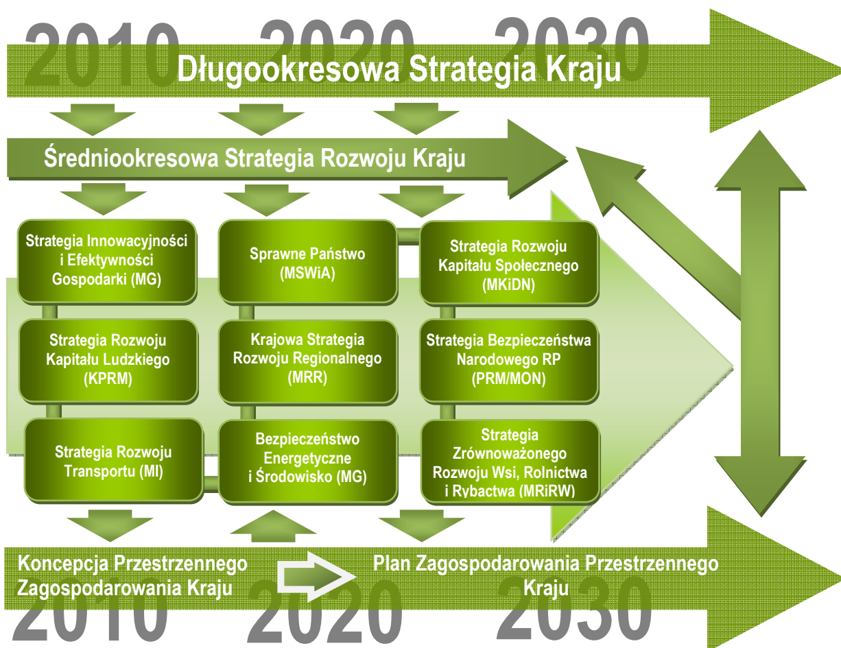
Rysunek: Nowy model zarządzania rozwojem kraju

będzie Średniokresowa Strategia Rozwoju Kraju z 10-letnim horyzontem czasowym, w korelacji z europejskim dokumentem programowym „Europa 2020”, oraz 9 zintegrowanymi strategiami dotyczącymi: Innowacyjności i Efektywności Gospodarki, Rozwoju Transportu, Bezpieczeństwa Energetycznego i Środowiska, Rozwoju Regionalnego, Rozwoju Kapitału Ludzkiego, Rozwoju Kapitału Społecznego, Zrównoważonego Rozwoju Wsi, Rolnictwa i Rybactwa, Sprawnego Państwa oraz Rozwoju Systemu Bezpieczeństwa Narodowego. Ważnym elementem porządku planowania strategicznego w odniesieniu do dokumentu „EU 2020” jest Krajowy Program Reform, a także cyklicznie aktualizowane: Wieloletni Plan Finansowy Państwa oraz Aktualizacja Programu Konwergencji.